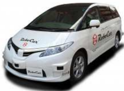
ZMP RoboCar® MiniVan

カメラやセンサーで周囲の環境や車両等を認識し、自動で走行する自動運転車両です。ハンドル、アクセル、ブレーキなどすべての運転操作はコンピュータが行います。