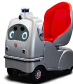
ZMP Robocar® Walk

カメラやセンサーで周囲の環境や車両等を認識し、自動で走行する自動運転車両です。ハンドル、アクセル、ブレーキなどすべての運転操作はコンピュータが行います。